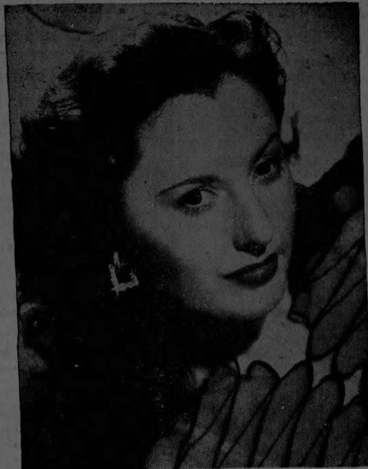
Dice Max Factor Jr., el famoso experto en glamor de la capital del cine, que si quiere usted tener el cabello tan suave y adorable como el de la encantadora estrella de Hollywood BARBARA STANWYCK, no debe exponerlo al sol durante demasiado tiempo.

Durante muchos años se ha aconsejado a las mujeres que no se asoleen rápidamente, sino que lo hagan